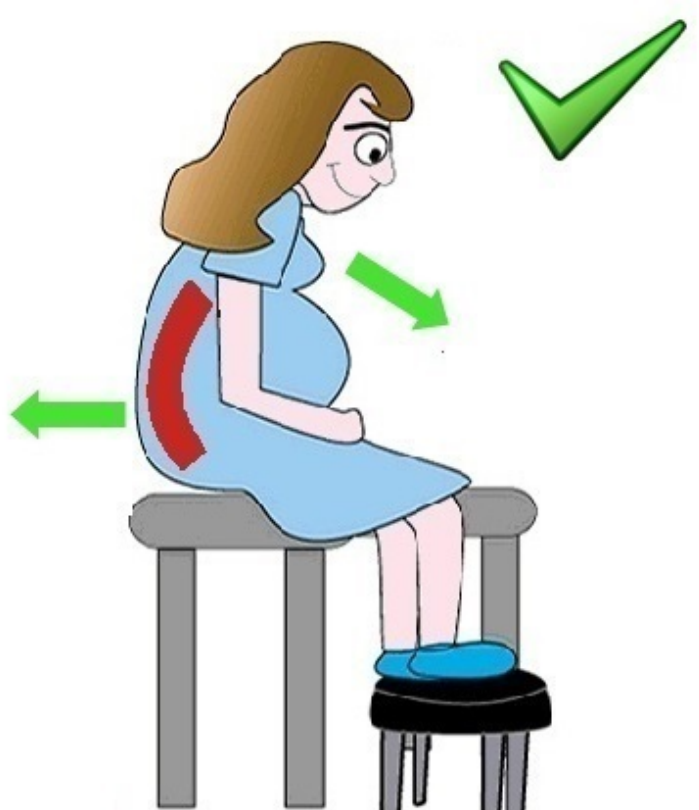
Sturme, Chambers & McNamara